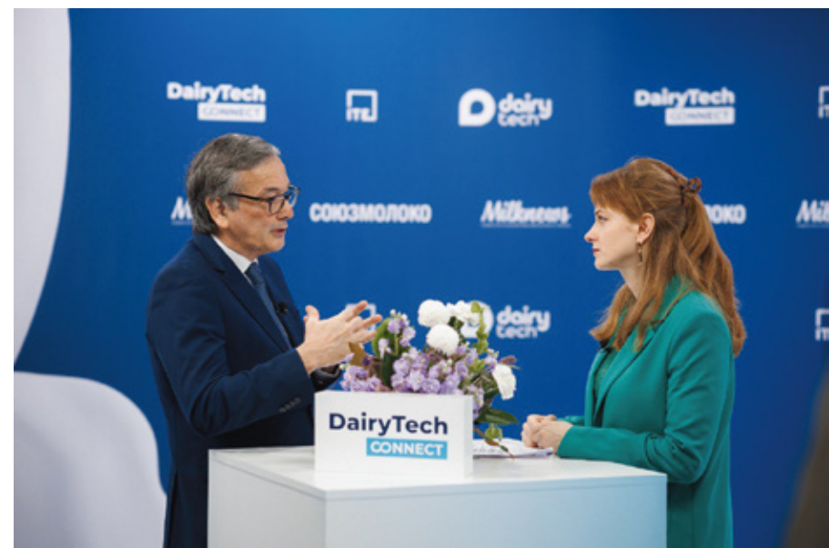
Чрезвычайный и Полномочный Посол Аргентинской Республики в Российской Федерации Энрике Игнасио Феррер Виейра