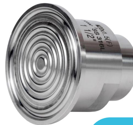
разделитель мембранный Tri-Clamp